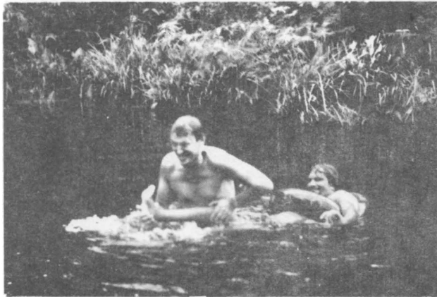
6. Cola kreek me hamlog pauriela.