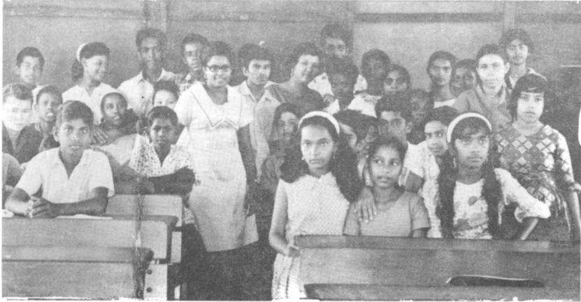
1. Hamaar skoel ke foto. Ham ekdam bietje me baatie.