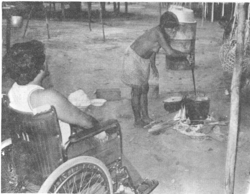
8. Ham sab djagaha djaai sakiela djaha doesar manai 1. j bhie dja hai. Hia ham ekgo Trio Iengie ke gaaw me hai.