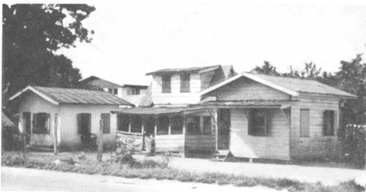
2. Ehie djagaha me ham paida bhailie.