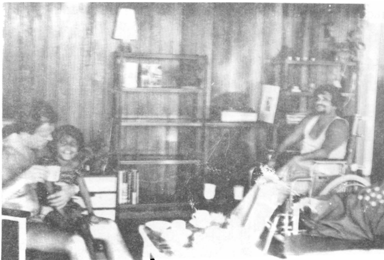
7. Hamaar tjhota bahien doedh pieje hai.