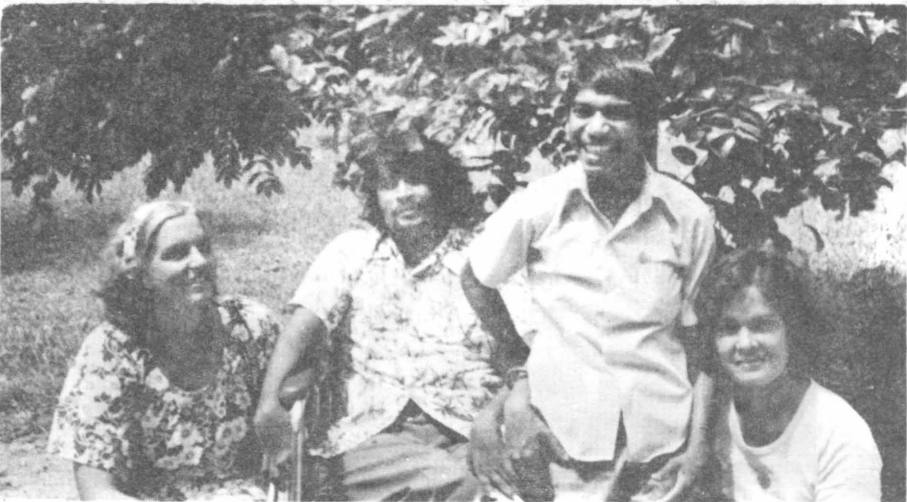
4. Ham aapan doei bahien aur tjhota bhaai ke saath ghoemat rahieliie.