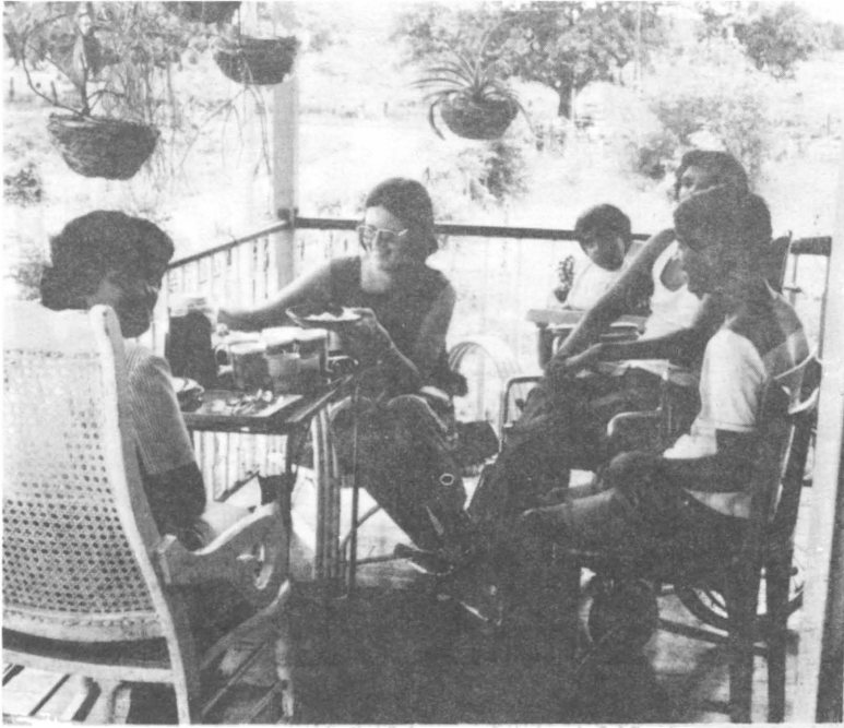
5. Hia hamlog khaaila.